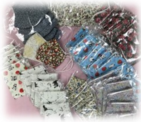
沢山の手作りマスクもいただきました

新型コロナウイルス感染拡大防止のため、3月よりケアプラザの事業や貸館、ボランティア活動などをお休みする事となり地域の皆様方にはご不便をお掛け致しました。こちらのコーナーでは地域でご活躍されているボランティア様をご紹介させて頂いているのですが、今回は緊張状態が続いている中、地域の方々・複数の企業様からの心温まるご支援やご寄付を頂きましたのでお礼とご紹介をさせて頂こうと思います。マスクや合羽などの物資をはじめ、お電話で温かいお言葉を掛けて下さり、当館へのご配慮を頂いております事に、心より感謝申し上げます。頂いた物資に関しては、法人内で有効に活用させて頂きたいと思っております。地域の皆様からの温かいご支援、ご声援が何よりの励みとなっております。これからも全職員一丸となって、安心・安全・信頼されるような地域の保健福祉活動の拠点として努めて参りたいと思っております。