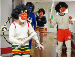
鬼がやって来ました！