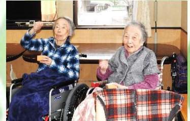
「鬼は外ー！ 福は内ー！」

2月3日、緑の郷で豆まきを行いました。 ご入居者皆に鬼退治をしていただきました！