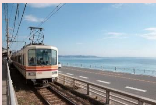
電車から海が見える江ノ電