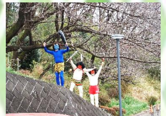
鬼は裏の山に消えていきましたとさ！