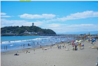
海水浴客でにぎわう江ノ島海岸