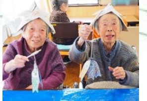
お魚釣りゲームでした！