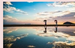
フォトジェニックな父母ヶ浜

『瀬戸内国際芸術祭』は瀬戸内の美しい景色と現代アートの融合として近年世界中から注目を集めているらしい。穏やかな風を感じられる瀬戸内で、風光明媚な島々を巡りながら自然に溶け込む芸術作品を楽しむ行程は、さながらアートな旅に違いない。また三豊市にある『父母ヶ浜（ちちぶがはま）』は約 1 km のロングビーチを誇る海水浴場として SNS 映えするフォトジェニックスポットなんだとか。とにかく食べ物も美味しい、他にも色々あるけん、よかつたら、いっぺん行ってみまい！！