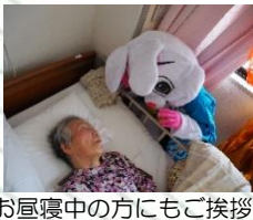
お昼寝中の方にもご挨拶