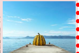
自然と調和するアート