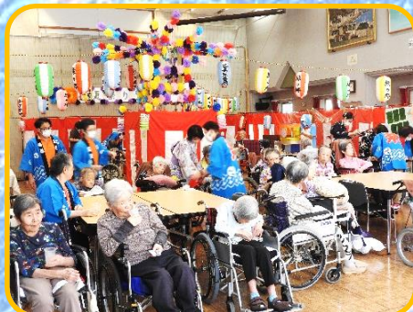
大ホールにやぐらを組みました アイスを食べながら太鼓を見たり、踊ったり。