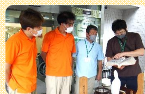
物故者帳を開くと懐かしい方々のお名前が。思い出話しがつきません。