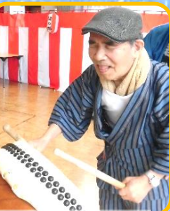
見事なばちさばき！