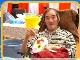
手作りのうちわを片手に