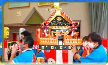
お神輿の登場だ〜!!ワッショイ