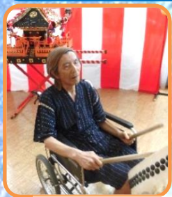
どんがどん！決まっていますね！