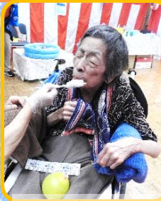
ふわふわおいしい