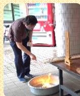
大きな火でお迎えます。

大ホールに盆棚を作りました。緑の郷でお亡くなりになった方を悼みお線香を上げさせていただいています。また迎え火送り火を焚きました。