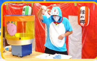
謎のわたあめ職人降臨!?