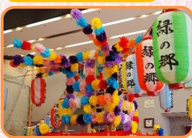
大ホール内にやぐらを組みました。