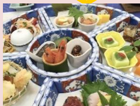
卓袱料理 豪華です！