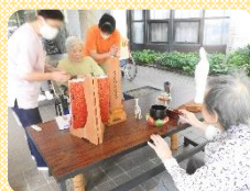
ご入居者に「もお線香をあげていただきました。