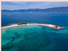
美しい白浜の「水島」