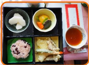
心づくしのお祝い膳