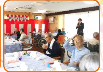
お祝い膳楽しみだなあ