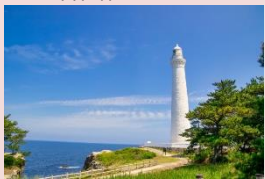
白い灯台に青い海と空が美しい