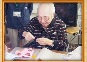
きれいな葉っぱだね