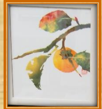
ちぎり絵で季節 を感じます