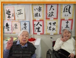
ご自分の作品と記念撮影