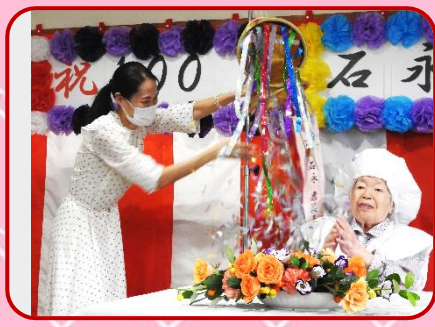
緑の郷名物くす玉