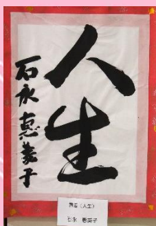
100歳の書。人生100年の感慨