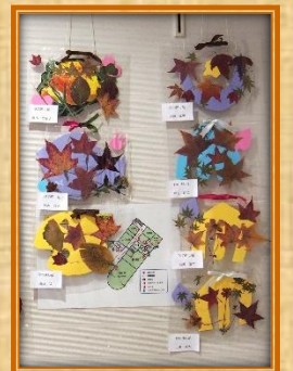
押し花ラッピング。 センスが光ります！