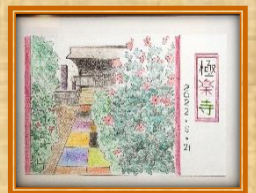
緻密な絵に引き込まれます