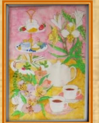
暖かい色合いに ホッとします