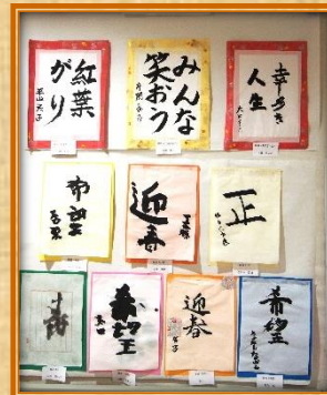
それぞれが味わい深い