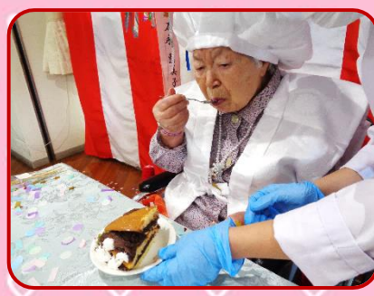
お味はいかがですか