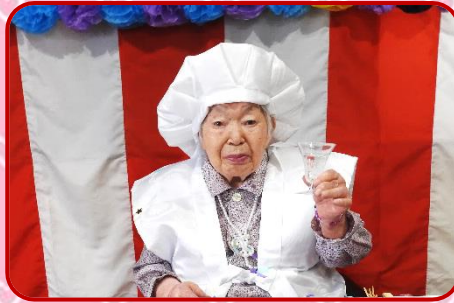
お誕生日おめでとうございます！乾杯～！！