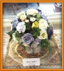
紙粘土アート 本物みたいですよ

緑の郷では今年も「ふれあい作品展」を開催しました。 今年はデイサービス、桃の実も参加しにぎやかな作品展となりました。皆様の力作をご覧ください！