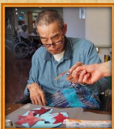
どこに置こうかな