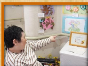
これが私の作品よ！