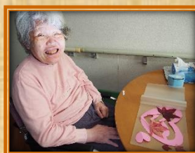
こんな感じでどうかしら？