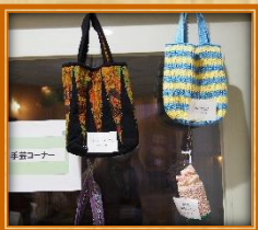
丁寧な手仕事が素敵です