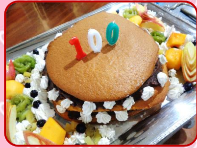
栄養調理課渾身のどら焼きケーキ