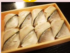
思い出の鰹の押し寿司