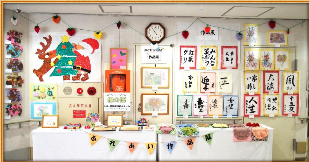
緑の郷エントランス正面にて開催しました