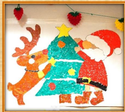
4丁目ご入居者合作の貼り絵