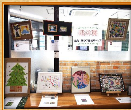
桃の実ご利用者の力作