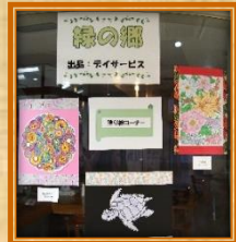
細かい塗り絵は根気 が必要です