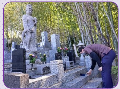
丁寧にお掃除します。

緑の郷には近隣の宗英寺に永代供養塔があります（平成7年12月建立）。毎年、お盆やお彼岸にはお墓参りに行きます。今回は、3月18日に行って参りました。