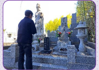
お花とお線香をお供えます。