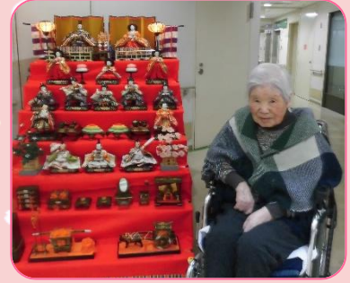
見事な段飾り。壮観です。