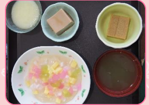
お昼ご飯はちらし寿司。