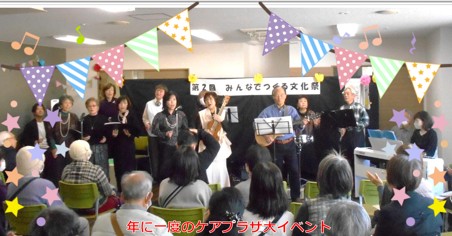
年に一度のケアプラザ大イベント