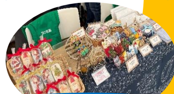
地域の福祉施設による 商品販売